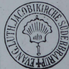
Reisiegel Pilgerstab mit Pilgermuschel