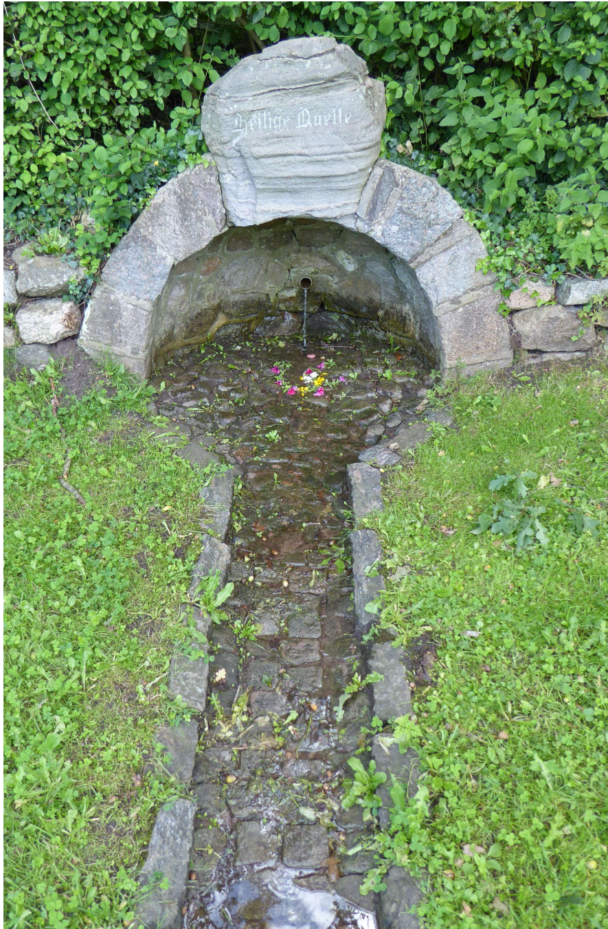
Wasserauslauf der ehemaligen „Heiligen Quelle“